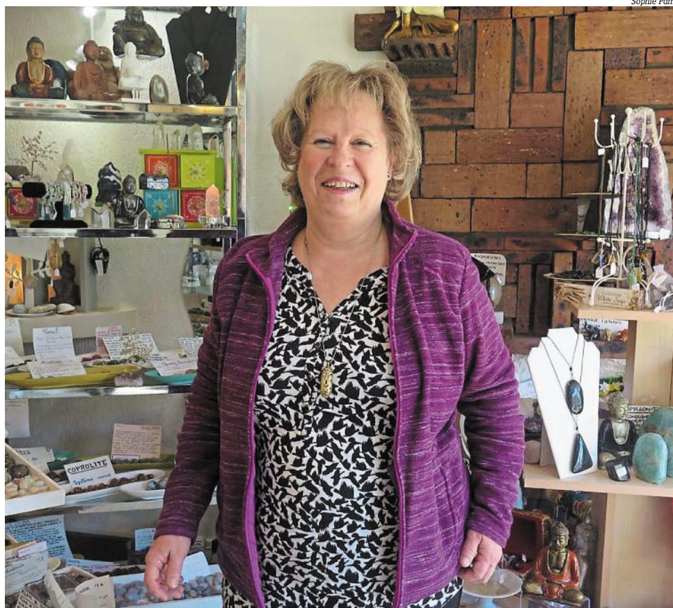
La commerçante mancelle vient de fêter les cinq ans de Minéraux et Pierres de Soins.

Les bols de cristal et bols tibétains en métal permettent de recharger les pierres.